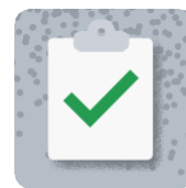
Zelené obstarávanie a úradovanie