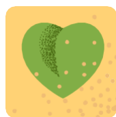
Zeleň a ochrana prírody