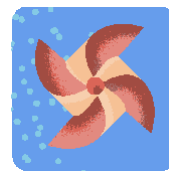
Doprava a ovzdušie