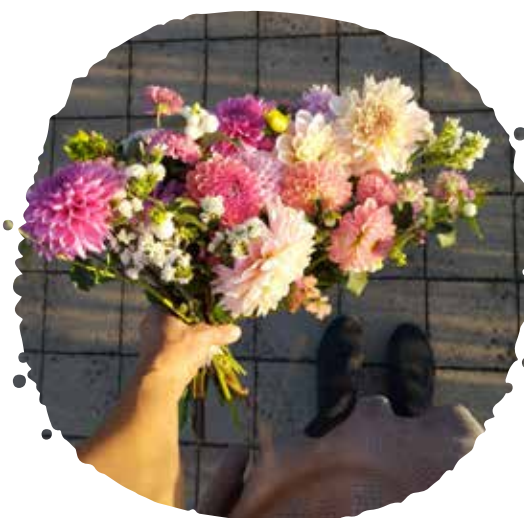
Živá kytica bez obalov a bez stúh