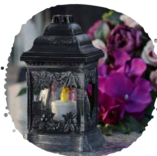
LED kahance (sviečky na batérie)