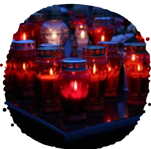
Kahance na sviečky z rôznych materiálov – sklo, plast, kov, vosk