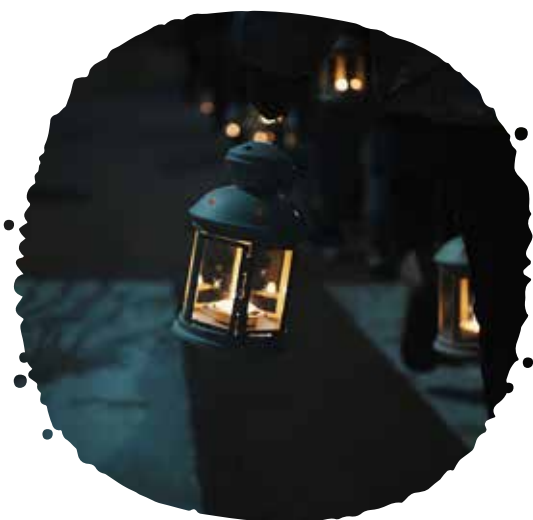
Svietnik, napr. na malé čajové sviečky