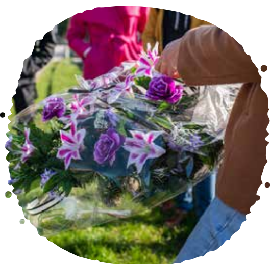
Plastový veniec v celofáne