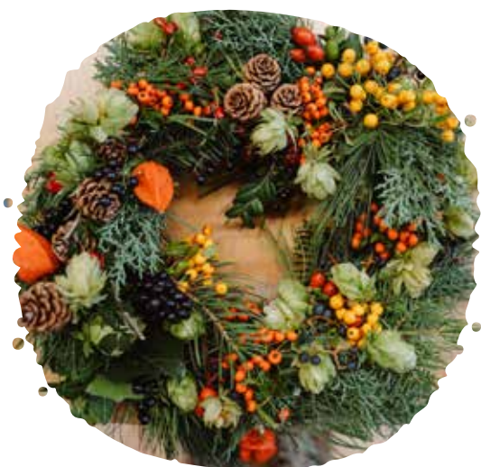
Prírodný veniec z ihličia a jesenných plodov