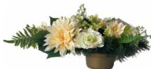
Plastová kytica v kvetináči zaliata v betóne